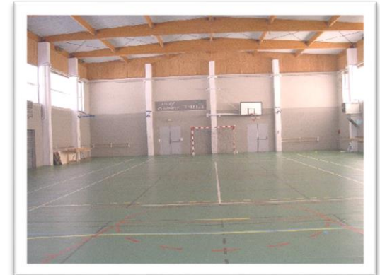
Le gymnase Tarket (32x19)

Le centre met à votre disposition des équipements intérieurs et extérieurs complets et modulables.