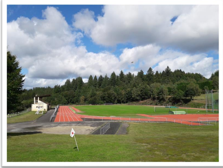
La piste d'athlétisme et le terrain de football