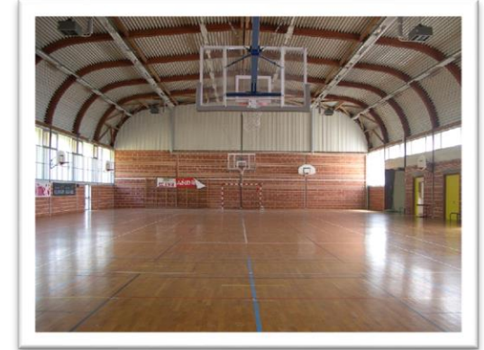
Le gymnase Parquet (44x22)