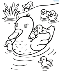
une cane et ses canetons