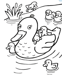
une cane et ses canetons