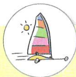
char à voile