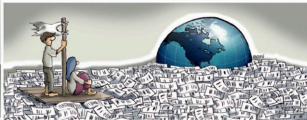
Nani (Colombie / Espagne)

création de refuges par l'état pour les ukrainiens